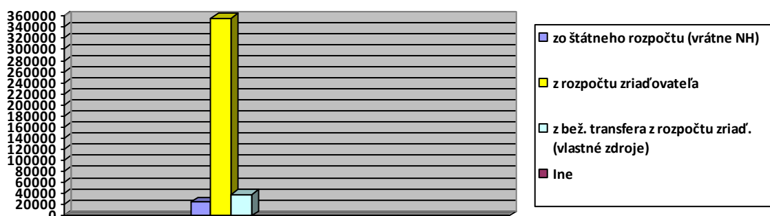
Grafické vyjadrenie skladby výdavkov k 31.12.2022