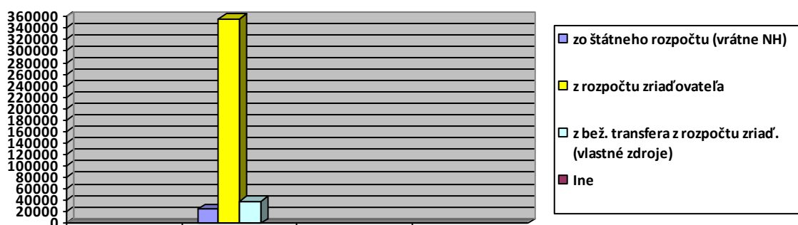
Grafické vyjadrenie skladby výdavkov k 31.12.2022